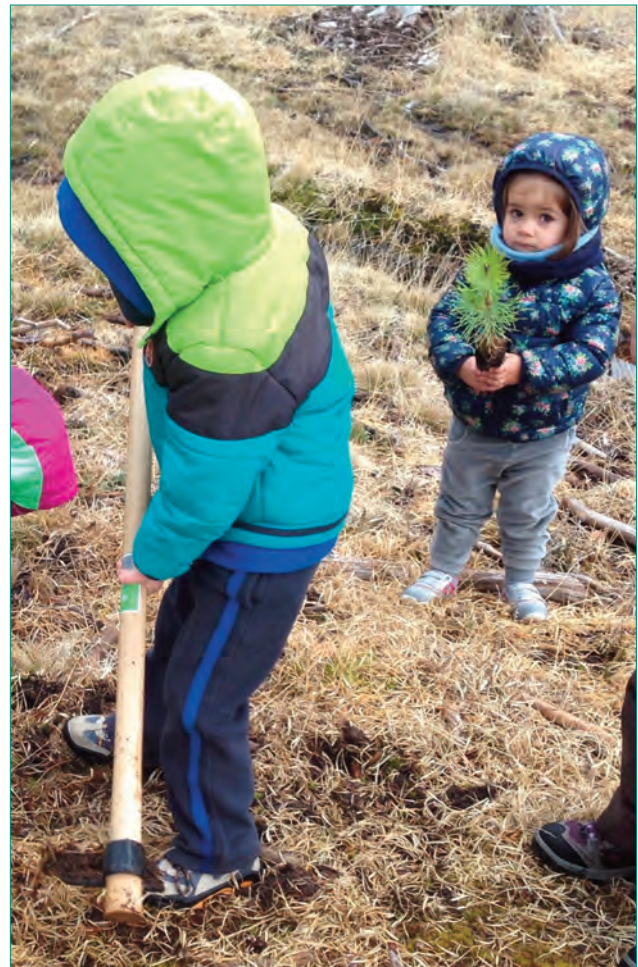
Los más pequeños también esperan recuperar cuanto antes su estrecha relación con los bosques

Como homenaje a todos los pinares, encinares, robledales, sabinares, hayedos, bosques de ribera y resto de ecosistemas forestales de la provincia de Burgos, a todos los servicios que prestan a los habitantes de nuestro medio rural y a esa relación estrecha que nos une a ellos, queremos unirnos a la celebración del Día Internacional de los Bosques, esperando recuperar esta relación con más ganas que nunca cuando toda esta situación excepcional acabe.