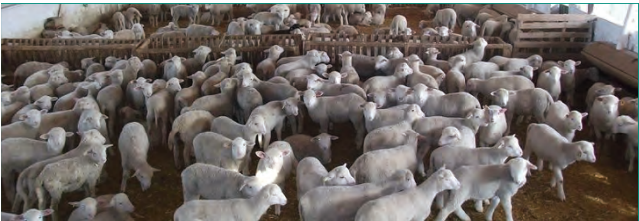
Las explotaciones en régimen intensivo son las que se ven afectadas por estas modificaciones

En cualquier caso, parece que la incertidumbre jurídica se ha despejado para los secretarios municipales en el sentido de que todas las explotaciones ganaderas no orientadas al autoconsumo doméstico ni al régimen extensivo vuelven a requerir licencia ambiental en Castilla y León, debiendo someterse a información pública, informes previos y audiencia a los vecinos colindantes antes de su puesta en funcionamiento.