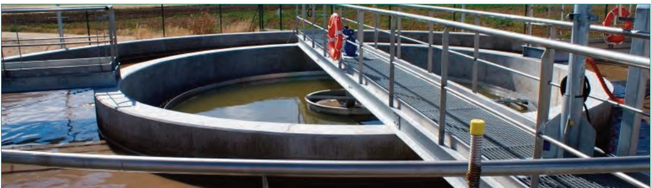
La Junta Vecinal de Barcenillas de Cerezos fue una de las entidades premiadas en 2019 por el proyecto de su nueva depuradora

la octava edición de los Premios Provinciales de Medio Ambiente busca ya sus candidatos. En esta ocasión se han introducido algunas novedades en la distribución de los premios por categorías, eliminándose la diferenciación entre proyectos de medio natural y de calidad ambiental para facilitar la presentación de solicitudes y su evaluación por el jurado técnico. Las bases de la convocatoria, dirigida a todas las entidades locales (mancomunidades, ayuntamientos y juntas vecinales y administrativas) del medio rural de la provincia, se publicarán en el Boletín Oficial de la Provincia y en la web www.burgos.es una vez que se reanuden los plazos administrativos interrumpidos por el estado de alarma, y el plazo para presentar las solicitudes se abrirá durante veinte días hábiles desde su publicación.